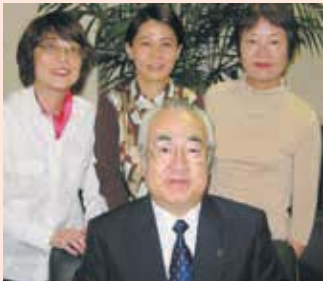
第1回研修会(平成17年7月)