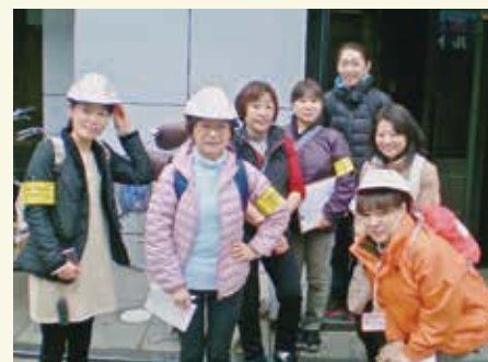
協議会に「災害プロジェクト」誕生

ステーション独自での対応が困難な部分を災害対策委員会で対応することを目的としています。