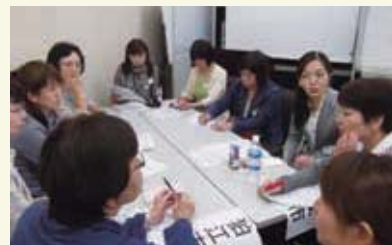
地域の看護師ネットワーク研修会

当初11ブロックで活動していましたが、多摩地域の広さと、アクセスの不便で、北多摩ブロックを3ブロックに地域分けをし、より効果的な活動が出来るように分割し、現在は12ブロックでの各地域に密着した活動をしています。