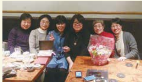
研修委員会のメンバー

能性に大きな反響があります。委員長は4人代わりましたが、常に活気にあふれています。