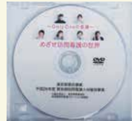
DVD 「Only Oneの看護・めざせ訪問看護の世界」

材確保事業の委託もあり、協議会を中心に実行委員会を結成、「訪問看護フェスティバル」の実施やリーフレット、DVD「Only Oneの看護・めざせ訪問看護の世界」などを作成しています。東京都、東京都看護協会と東京訪問看護ステーション協議会は一体となって、訪問看護の発展をめざし活動しています。