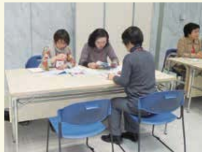
訪問看護フェスティバルでの相談風景

政策提言などはまだ力が及びませんでした。「看護フェスタ」で健康・療養相談、介護相談は年々評判を上げ、ブースへお越しになる方が100名を超えるほどになりました。多忙な業務の中での活動ではありましたが、それぞれの地域での課題などを学んだり、委員の皆さんに助言をいただいたりする事はとても楽しい時でした。今後も同じ訪問看