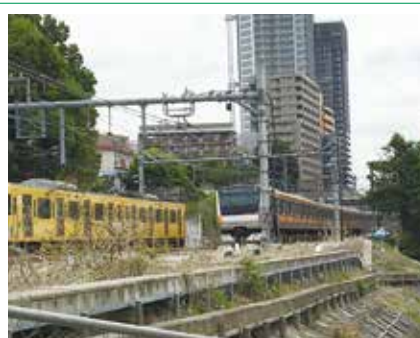
開発の進む国分寺駅方面