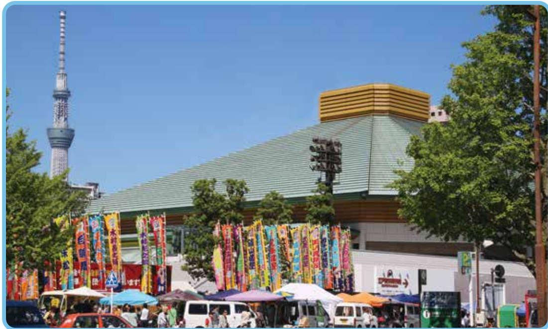
両国国技館(墨田区)