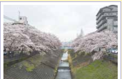
近くを流れる乞田川は桜がキレイです