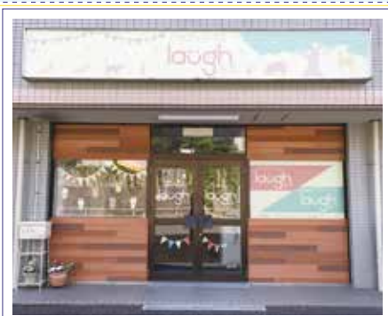
こどもデイサービスラフの外観