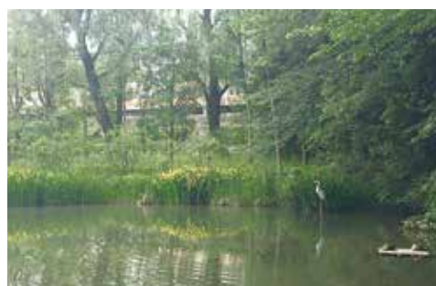
恋ヶ窪の遊女達が朝な夕なに姿を映した事から「姿見の池」と呼ばれている