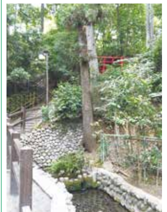
おたかの道湧水：現在遊歩道として整備され多くの人々に親しまれている