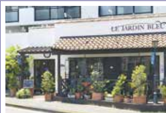
近くの美味しいケーキ屋さん