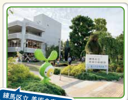
練馬区立 美術の森緑地

訪 問すると、利用者様やご家族様から気遣っていただいたり、天気や荷物の量を心配していただいたり、元気や笑顔をいただくことが多くあります。私たちも、ただサービスを提供するスタッフとしてではなく、人と人としてのつながりを大切に訪問していきたくと思っています。そして今後も、常に利用者様・ご家族様の良きアドバイザーでいられるよう努めていきたくと思います！