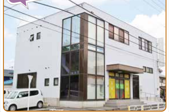
本部のある建物(立川市)