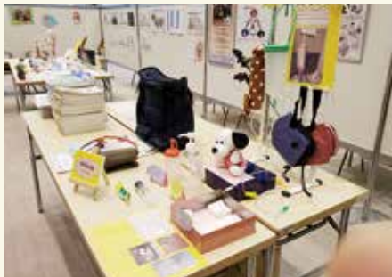
訪問看護師が工夫した優れた物品です。