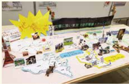
訪問看護ステーション協会でも防災の取り組みをしています。