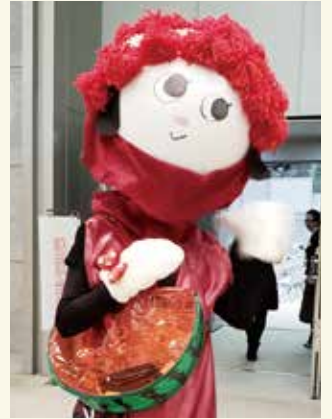
東京都訪問看護ステーション協会キャラクター「ほなと」に会長自ら変身!!今年ほなとちゃんも訪問バックを新調し活動していました。