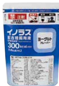
ヨーグルトフレーバー

◇効能・効果、用法・用量、禁忌を含む使用上の注意等は、製品添付文書をご参照ください。