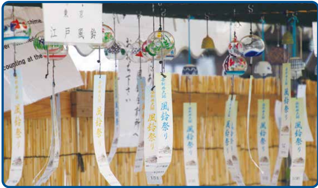
風鈴祭り (西新井大師)