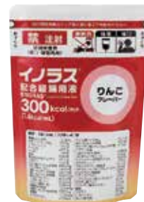
りんごフレーバー